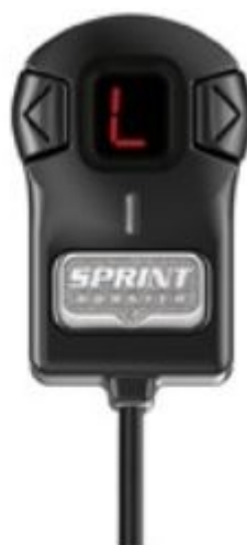
PEDAL LOCK MODE